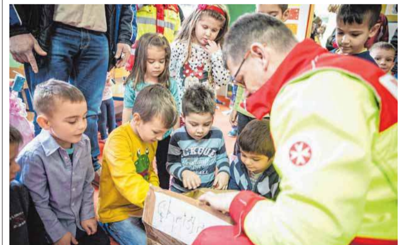
Neugierige und strahlende Kindergesichter gab es bei der Verteilung der Päckchen im vergangenen Jahr.