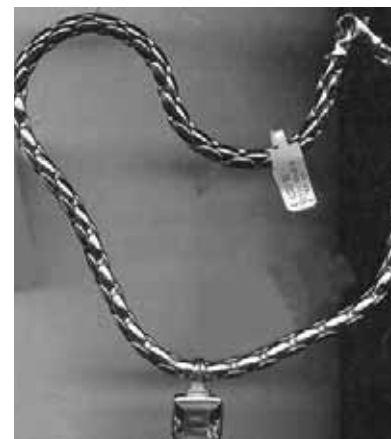
Einige Einzelteile des gestohlenen Schmucks: eine Goldkette ...

Die Kriminalpolizei Biberach bittet um Zeugenerklärungen zur beschriebenen Person oder dem Kleinwagen und um Hinweise zum Diebesgut unter Telefon 07351/4470