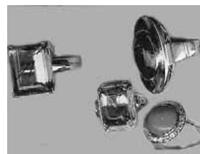
... mehrere Ringe ...