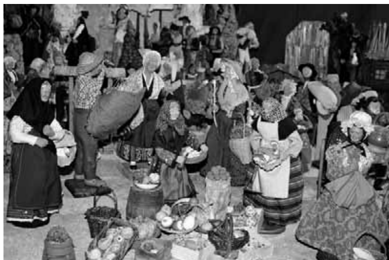
Weit mehr als heilige Familie, Ochs' und Esel: Etwas abseits vom eigentlichen Geschehen zeigt diese südfranzösische Krippe eine ländliche Marktszene.